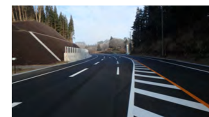
宝坂地区改良舗装工事（東北地方整備局 郡山国道事務所）