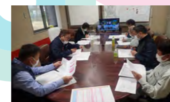
毎月の工程会議の風景