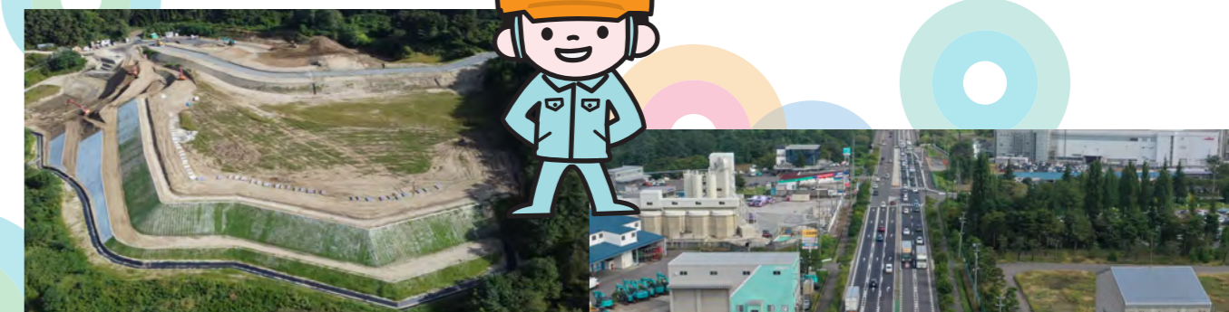
阿武隈川上流 郡山地区掘削工事 （東北地方整備局 福島河川国道事務所）