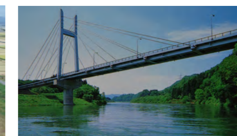
上郷舟渡線 地方道路改良工事（福島県 喜多方建設事務所）