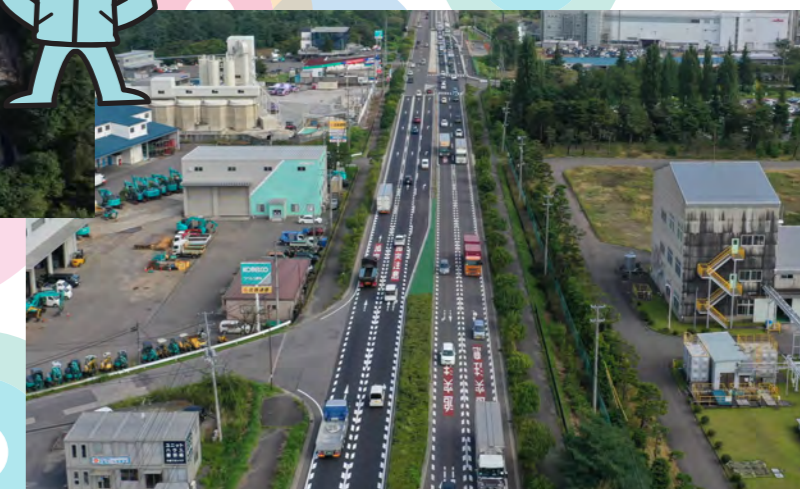
郡山国道管内駐車帯外整備工事（国道 4 号線）（東北地方整備局 郡山国道事務所）