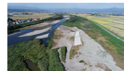
宮古弱小堤防対策他その 8 工事【佐野目工区】 （北地地方整備局 阿賀川河川事務所）