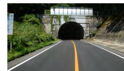
道路橋りょう維持（維持）工事（舗装補修）熱塩 （福島県 喜多方建設事務所）